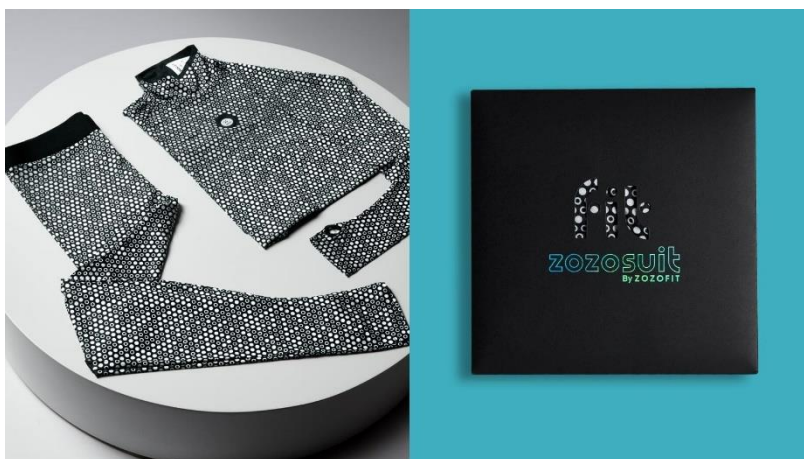
(左) ZOZOSUIT (右) パッケージイメージ