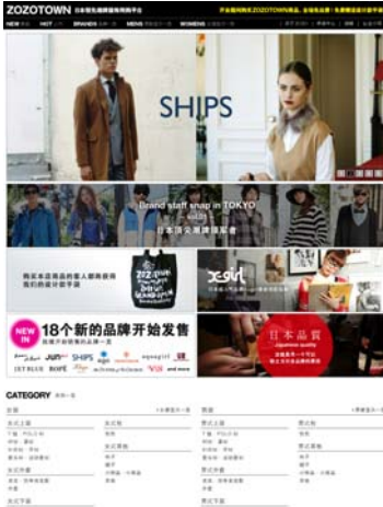
ZOZOTOWN CHINA サイトイメージ