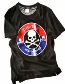
限定 T シャツ