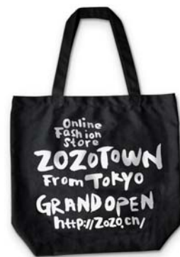
オリジナルトートバッグ イメージ

特典:投票して頂いた一般ユーザーの中から毎日抽選で3名様にトートバッグをプレゼント 投票して頂いた一般ユーザーの中から最終日に抽選で2名様にiPad2をプレゼント