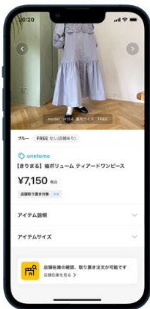
ZOZOTOWNの商品ページから 店舗在庫の確認ボタンを押す