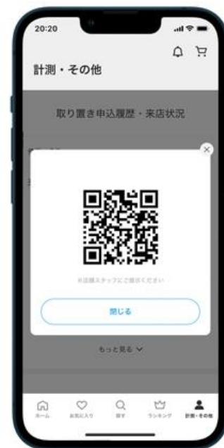
イベントに来場し二次元コードを 販売スタッフへ見せ商品を受け取る

※期間限定イベントのため、通常のZOZOMOで提供する実店舗の在庫確認および店舗在庫取り置きとは一部仕様異なります。