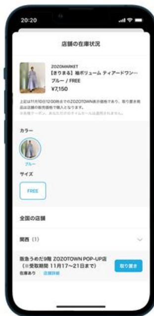
阪急うめだ9階 ZOZOTOWN POP-UP店を選択し、取り置きを依頼