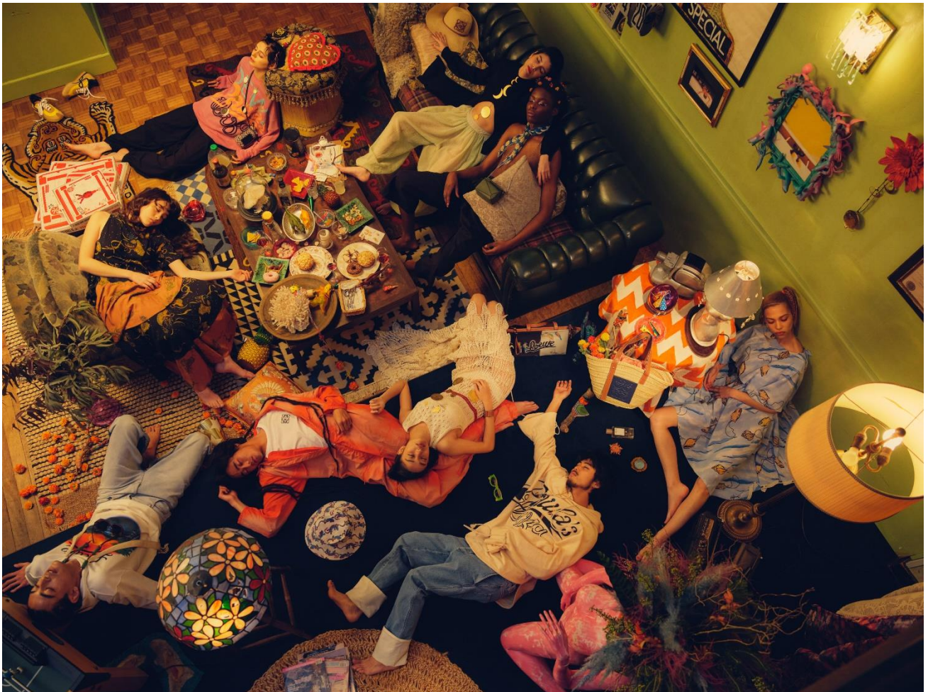
▲ルックブック内のカットの一部