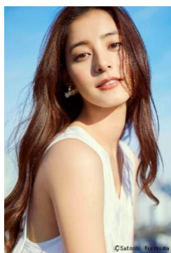
新木優子 (アラキ ユウコ)

モデル・女優。1993年12月15日生まれ、東京都出身。2014年、ファッション雑誌『non-no』（集英社）の専属モデルとなる。2015年、結婚情報誌の8代目CMガールに起用され話題に。CX『コード・ブルー -ドクターヘリ緊急救命-THE THIRD SEASON』、CX『トレース〜科捜研の男』、CX『SUITS/スーツ』シリーズなど人気ドラマや映画に多数出演しているほか、CX『モトカレマニア』、WOWOW『連続ドラマW セイレーンの懺悔』では主演を務めている。