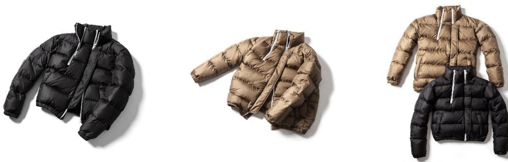
OUR DOWN JACKET 1(SHORT) ブラウン・ブラック/各 71,500 円 (税込)

アイテム名の通り、“私たちのダウンジャケット”はさまざまな対象の人たちに向けて作られています。そのため、サイズ1と2でサイズ差を大きくとりました。sodukを代表するMA-1のディティールとNANGAの定番のダウンジャケットのディティールを組み合わせてデザインされており、首部分に斜めについたファスナーは着用しながら温度調節できるようにと付けられました。腕部分につけられたワッペンが共布で縫い付けられておりユニークさをプラスしています。 ※数量限定商品