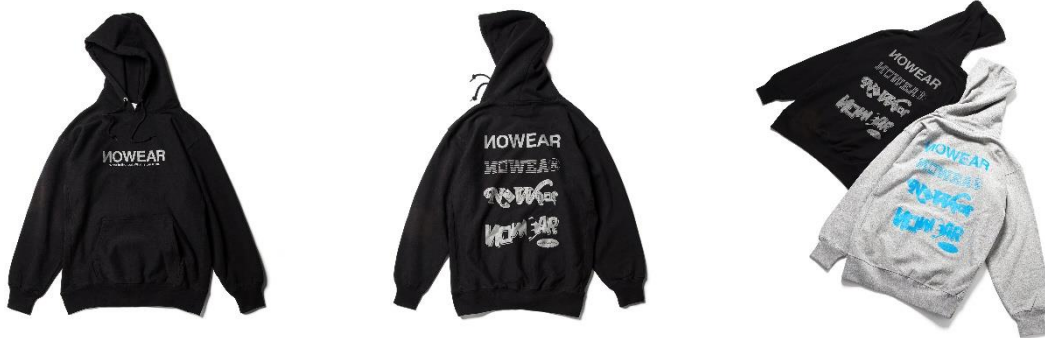
[NOWEAR×MASANORI MORIKAWA] Multi Logo Hoodie ブラック系その他、グレー系その他/各 15,400 円 (税込)